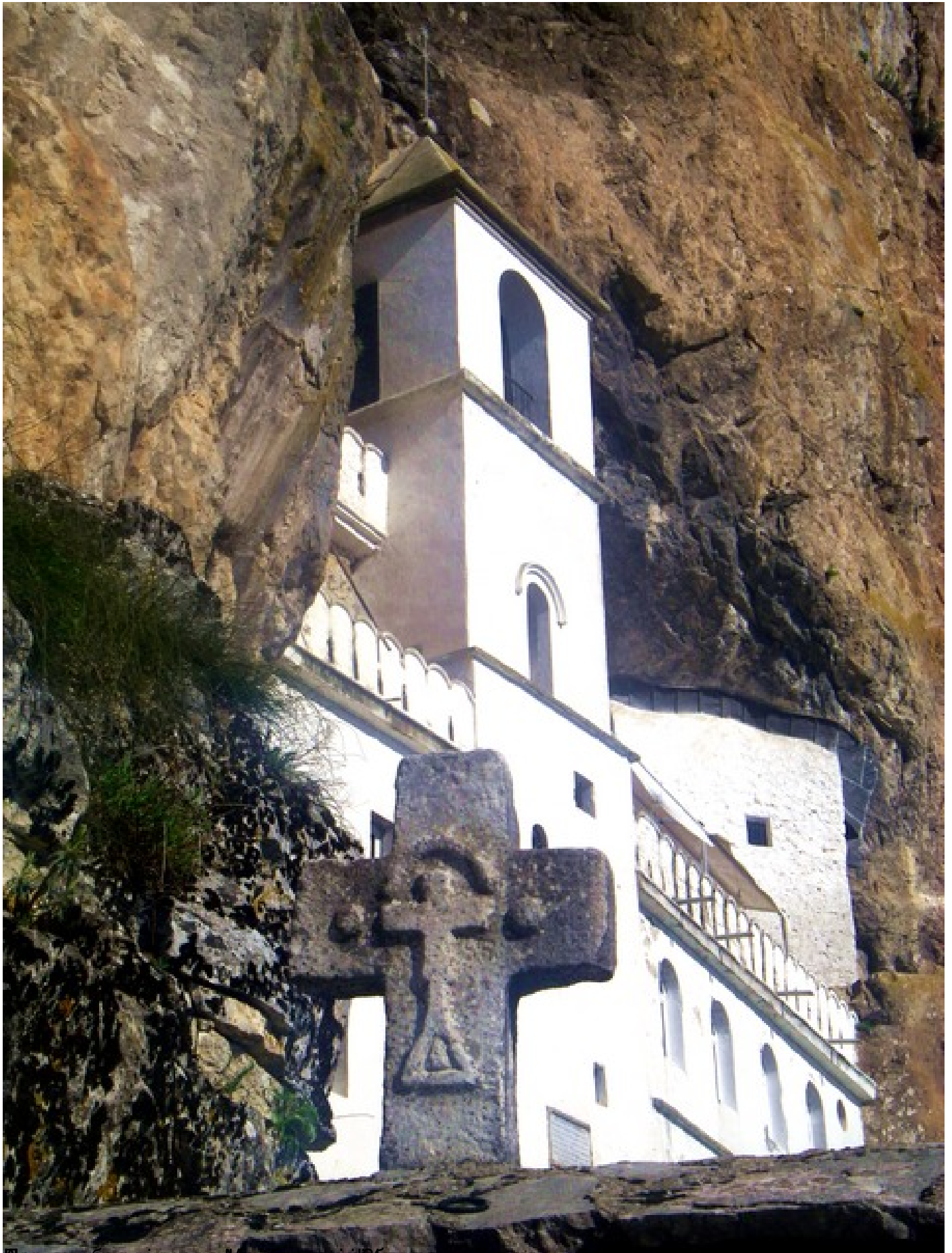
Црква Светог Духа у Златибору, Србија.

Пише: Велибор Џомић среда, 03 јул 2019 08:30