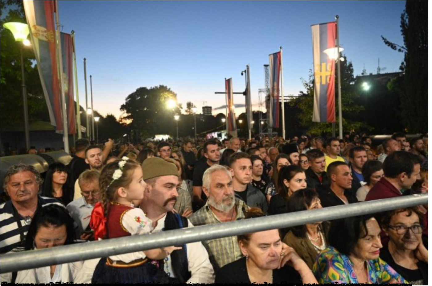
Урналица Светосавског просјава у Београду