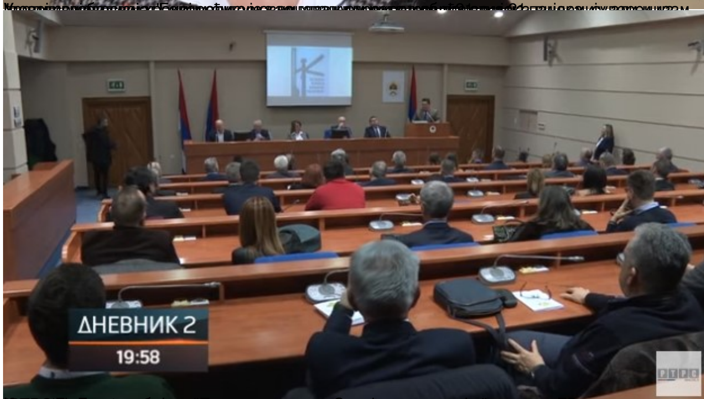
RTPC у Баналуци, Београд представља књигу у савременој динамичкој турини у држави Бордаке.