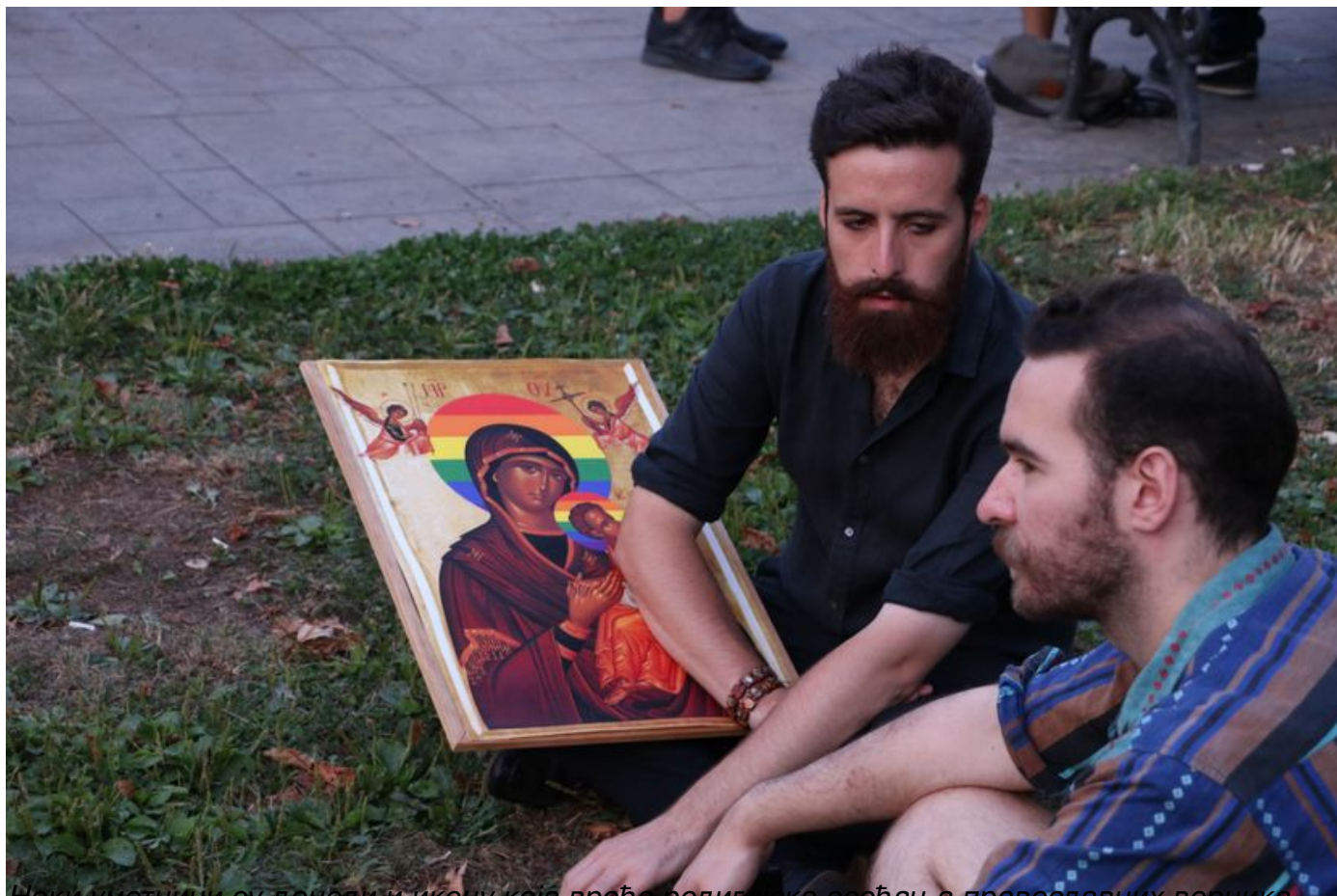
Неки уметници су донели и икону која вређа религијска осећања православних верника