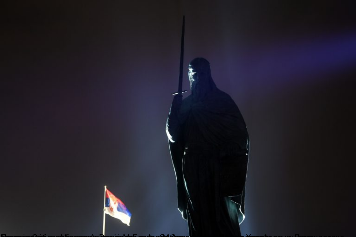
Датум: 27. јануар 2021. 22:18. Локација: Београд, Србија. Опис: Споменик Стефану Немани, који је отворено у Београду. Споменик је велики - зато што је прича о нама.