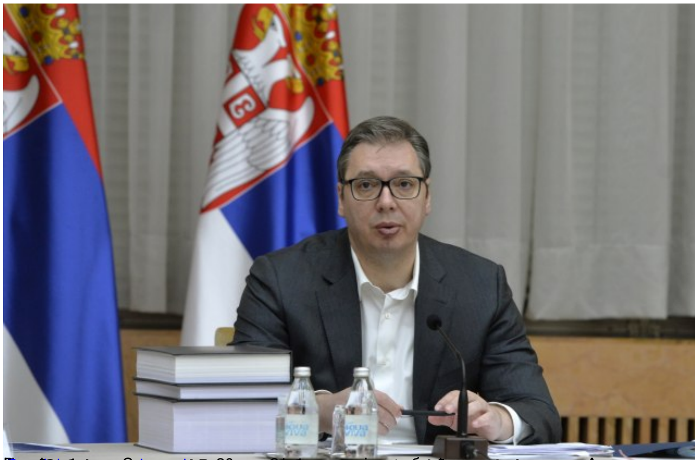
Председник Србије, Александар Вучић, на седnici Савета за националну безбедност у Београду, 7. марта 2021. године.