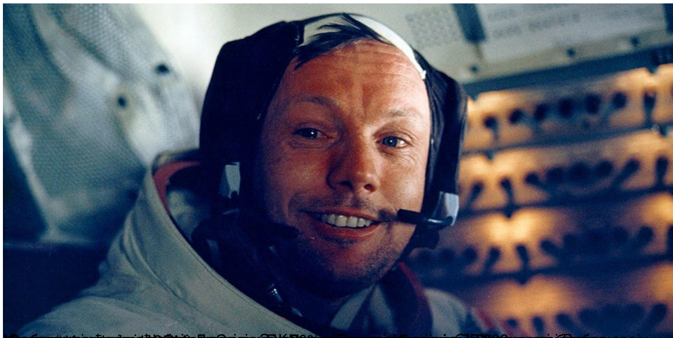
Бизнис инсајдер: Америчка и британска деца желе да буду јутјубери кад порасту, кинеска астронаут