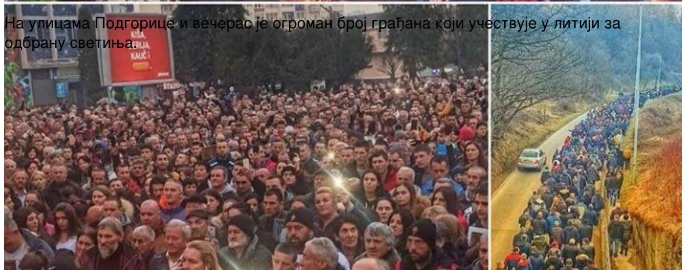
На улицама Подгорице и вечерас је огроман број грађана који учествује у литији за одбрану светиња.