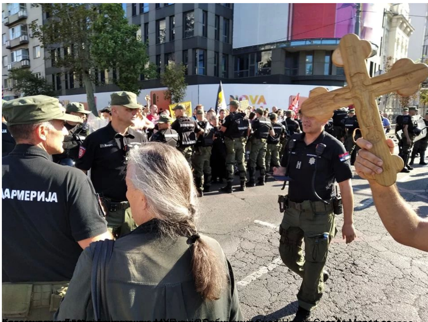
Београд, 15. септембар 2019. Група од око 150 људи протестује на углу Таковске и Булеvara краља Александра у знак протеста.