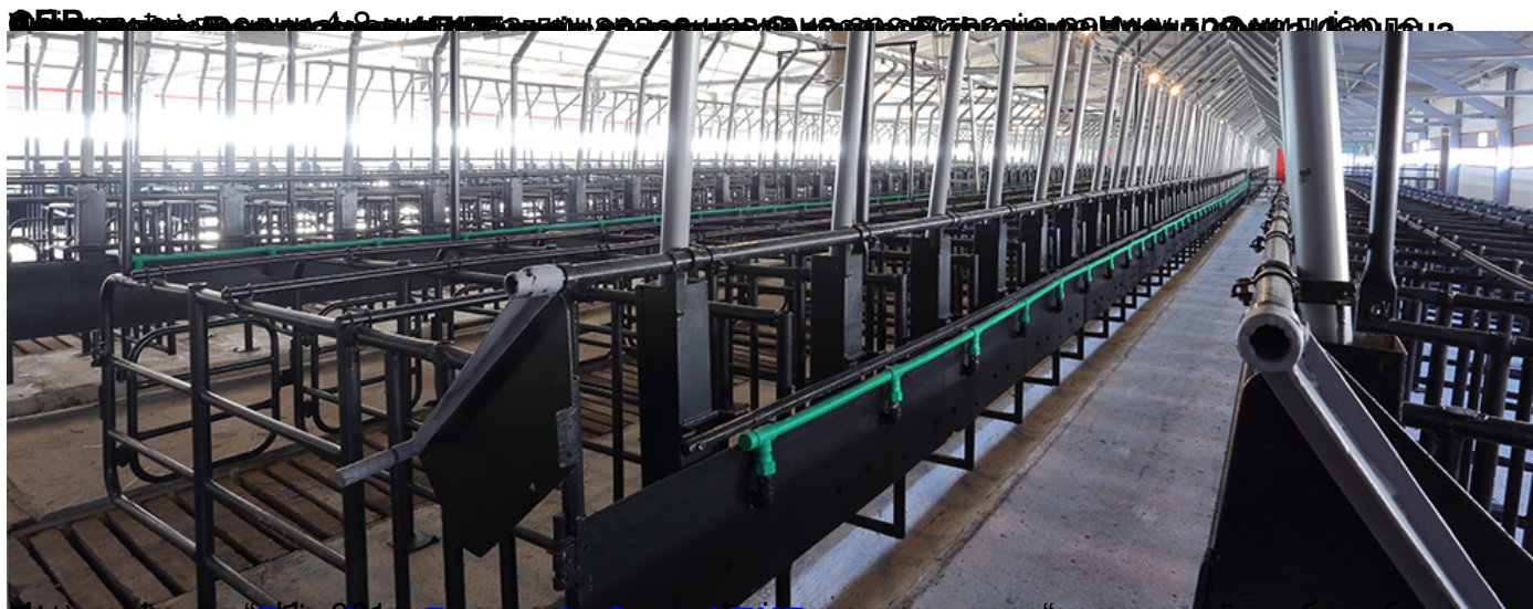
Данијела Ружић: Случај ПКБ – поставка економских околности