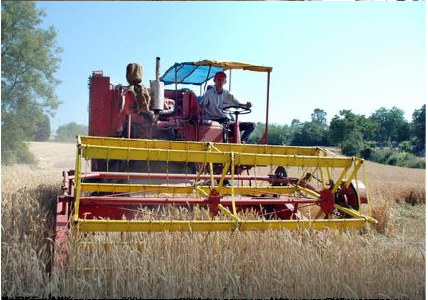
ПКБ Бранд ПКБ емајинг реџионалног ПКБ брја у поређењу Ал Дахри ПКБ корпорацију –