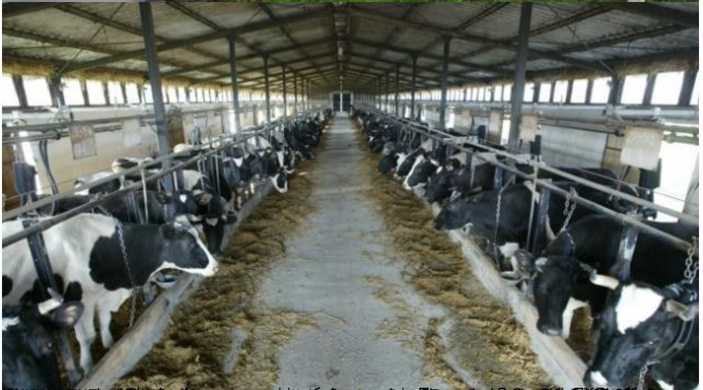
Слика: ПКБ корпорација, преосталог након продаје „Ал Дахри“ 2018. З