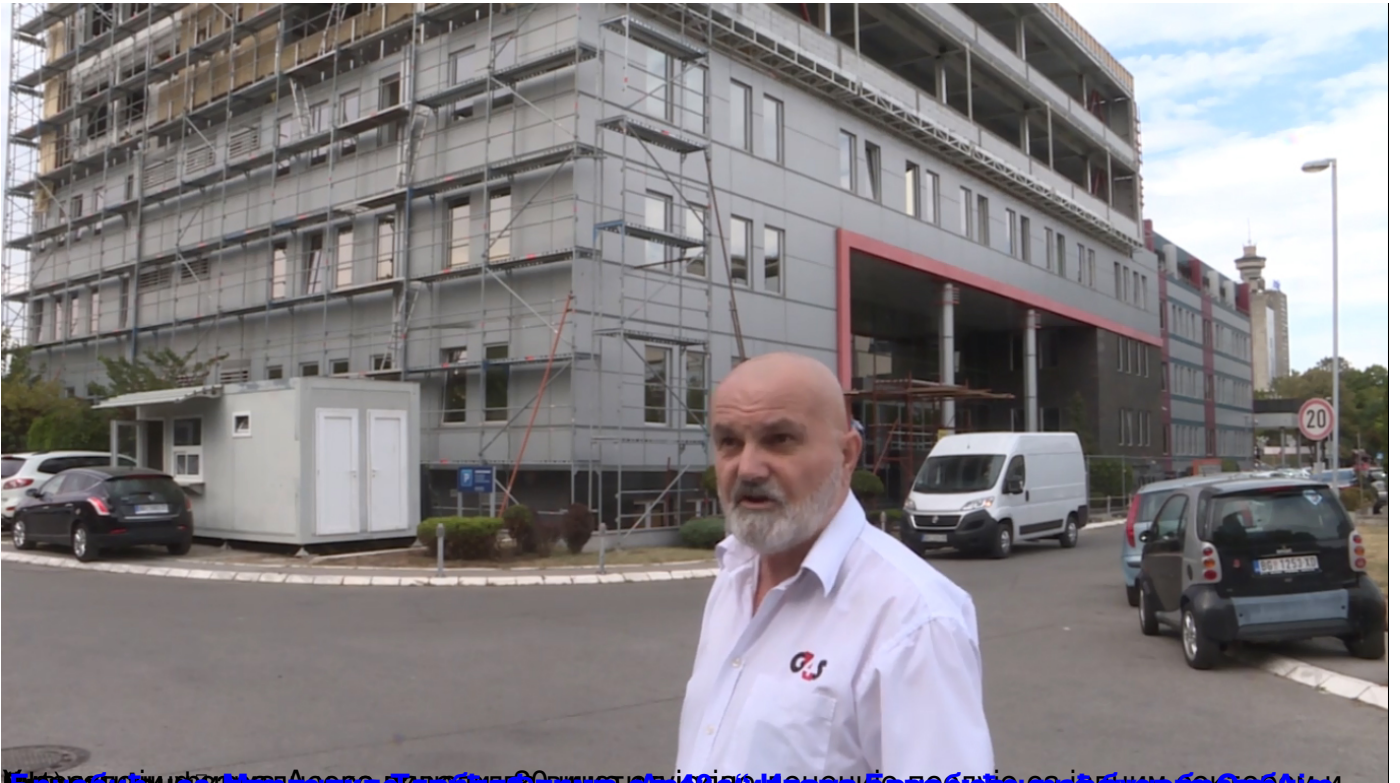
Брнаолић са Директора Градске управе одлучио да се не обрађује са једним од радника