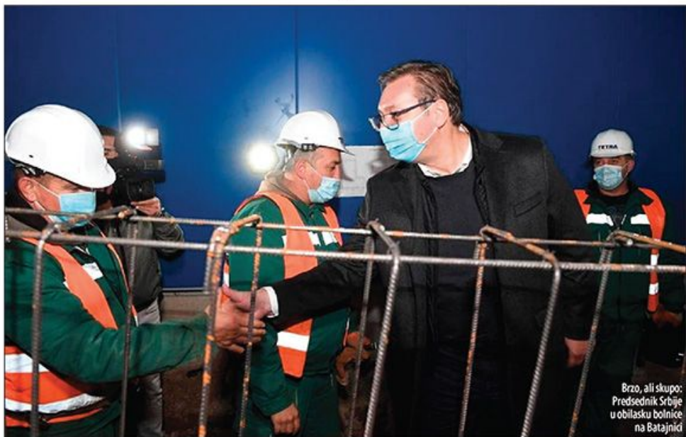
Brzo, ali skupo: Predsednik Srbije u obilasku bolnice na Batajnici

■ Građevinski stručnjaci zbunjeni izrazito visokom cenom – kruševačka košta 1.200, a batajnička 2.000 evra po kvadratu