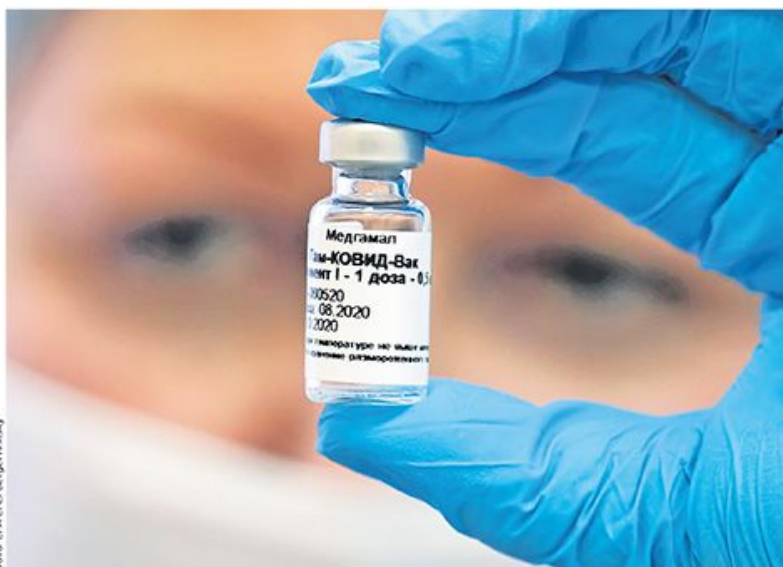
Онама: EPA-EFE/Sergei Ilnycky