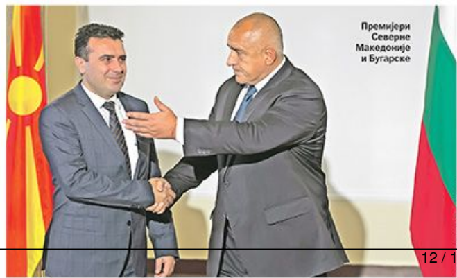
Премијери Северне Македоније и Бугарске

Бојко Борисов, некадашњи боксер, своје ударце из спорта пренео је у политички ринг