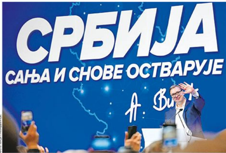
Председник Србије пред препуном халом у Краљево

није изнад закона и на оне који у све- му виде политички обрачун. Очекује се да ће се Трамп предати властима следећег уторка након што је њујоршко тужилаштво у четвртак против њега подигло оптужницу. Како преноси „Волстрит џорнал“, Трамп ће добровољно доћи с Флориде у Ве- лику јабучку па неће бити потребе за његовим хапшењем. Иако му можда неће бити стављене ланце на руке, мораће да остави отисак прета и да се слика за отварање досијеа у полици- ји. Њујоршка полиција се припрема за могуће нимбре. страница 3