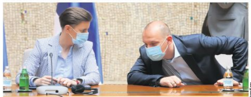
Ана Брнабић и Златибор Лончар јуче пред новинарима