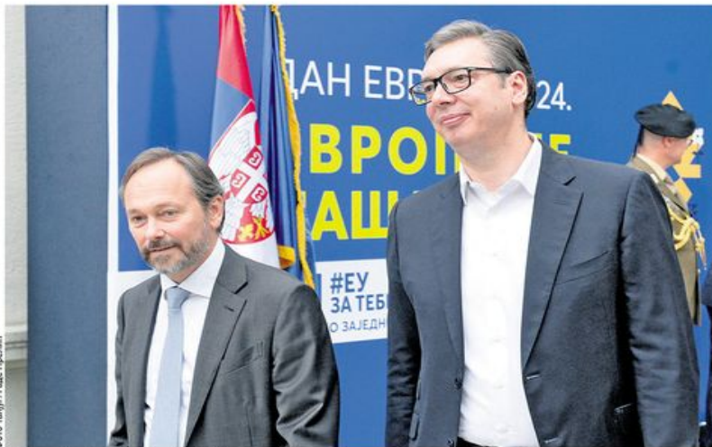
Емануел Жиофре и Александар Вучић