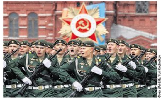
Учесници параде на Црвеном тргу у Москви