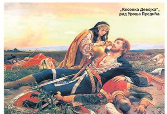
„Косовка Девојка“, рад Уроша Пређића

Већ при сусрету с домаћинима бива нам јасно да је Павле Орловић, који је појила Косовка Девојка, рођен ту у брзиди, али никаквог обележја па чак ни белега нема за који би се рекло да му је био дом. Ни трага легенди да је сахрањен ту, у родном селу, на обрниси Мокре горе, на самој међи са злогласном Дреницом. Кажу да је легенда и да је сахрањен под олтаром једне цркве на северу Космета.