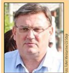
Povodom poziva Zorana Drobnjaka policiji da ne kažnjava bržu vožnju