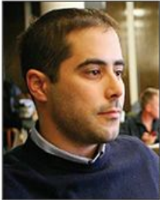
Advokati uvereni da tužilaštvo neće inicirati postupak zabrane Srpske desnice