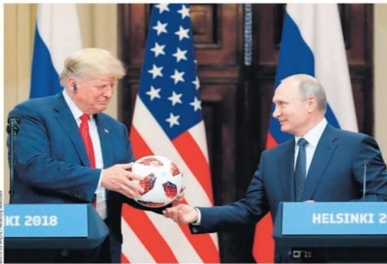
Сусрет Доналда Трампа и Владимира Путина у Хелсинкију, јул 2018. године