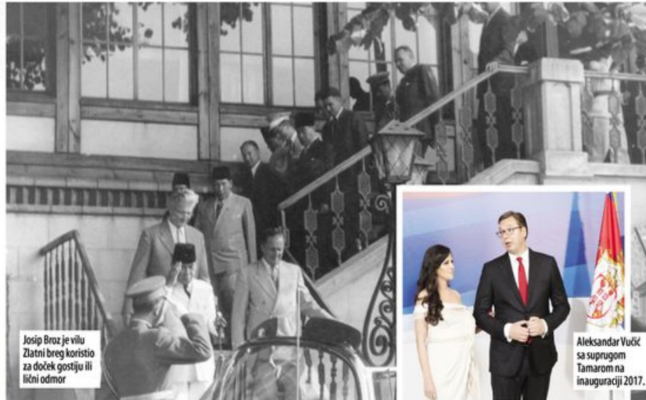
Josip Broz je vilu Zlatni breg koristio za doček gostiju ili lični odmor