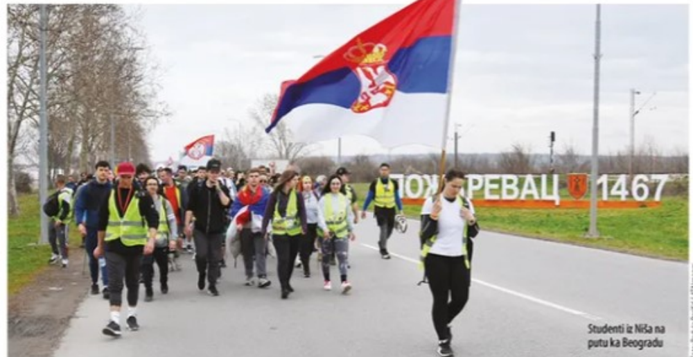
Studenti iz Niša na putu ka Beogradu