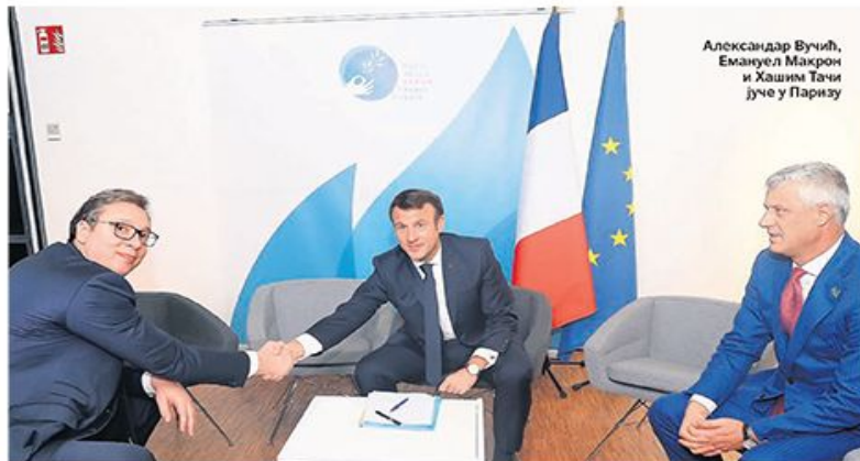
Александар Вучић, Емануел Макрон и Хашим Тачи јуче у Паризу

Емануел Макрон верује у могућност постизања договора о КиМ, поручио је председник Србије, који је уверен да ће од француског лидера добити подршку за иницијативу о „малом шенгену“