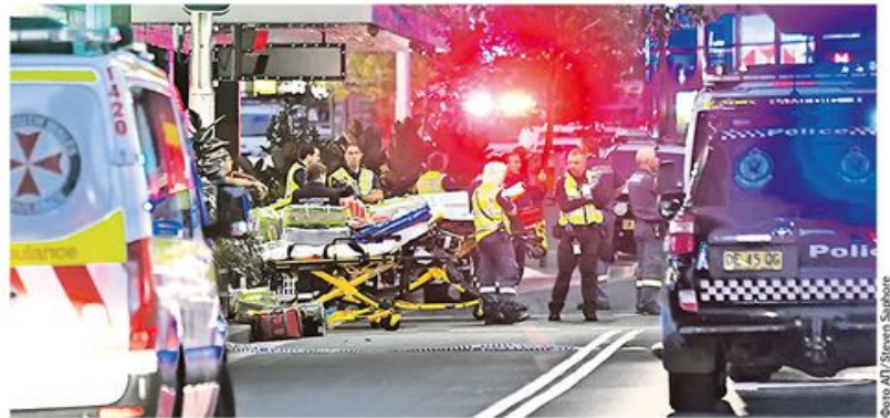
Екипе полиције и хитне помоћи износе рањене из тржног центра у насељу Бондај Цанкшиен