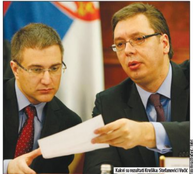
Kakvi su rezultati Krušika: Stefanovići Vučić

Ministarstvo životne sredine priprema podršku kupovini hibridnih automobila