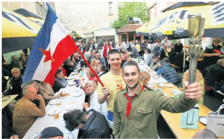
Од државе остала успомена: оставинска расправа међу чланицама давно нестале СФРЈ још није завршена

Национализована имовина српских компанија у Хрватској далеко превазилази вредност средстава бивше СФРЈ у мешовитим банкама