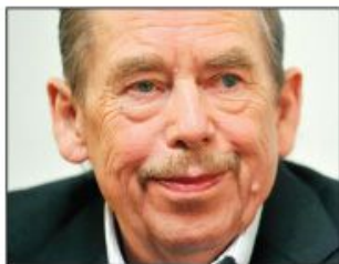
Tri decenije od Plišane revolucije i pada komunizma u bivšoj Čehoslovačkoj