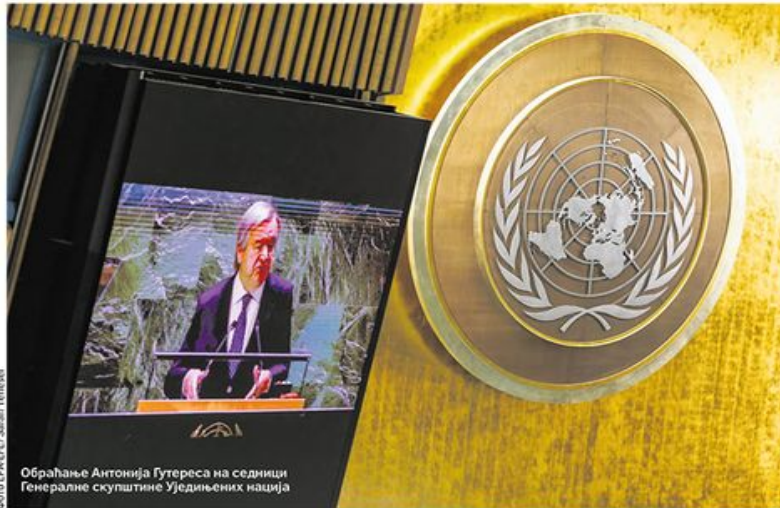
Обраћање Антонија Гутерреса на седници Генералне скупштине Уједињених нација

земљу: Сарајевско „Ослобођење”, погоричке „Вијести” и београдске „Данас” објавили су изнетове текстове у којима покушавају да докажу да Србија тиме крши стабилност у региону. „Кога погађају рафали”, поставља питање „Ослобођење”, „Србија рафалима” тресе или стабилизује регион”, наводи „Данас”, а наслов у „Вијестима” гласи „Рафалима маскирање диктатуре”.