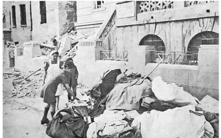
Разорено породилиште „Краљице Марије”, данашња Студентска поликлиника у Крунској улици