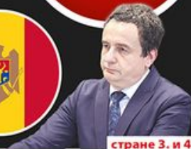
стране 3. и 4.