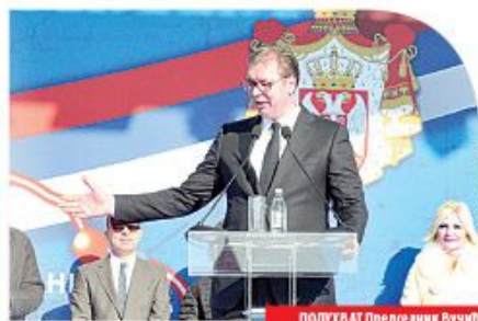
ПОДУХВАТ Пресе динк Бучић јуче на свечаности код Крушевца