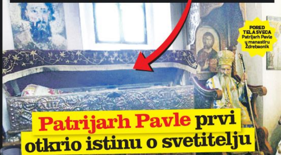
PORED TELA SVETA Patrijarh Pavle u manastiru Zdrebaonik