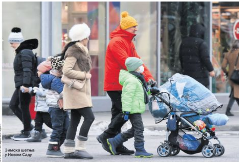
Зимска шетња у Новом Саду