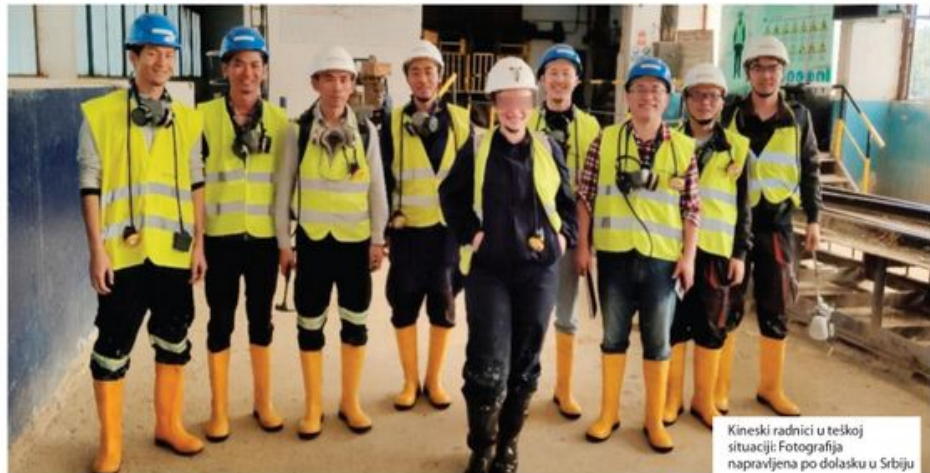
Kineski radnici u teškoj situaciji: Fotografija napravljena po dolasku u Srbiju