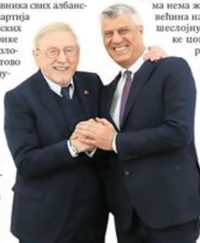
Вилијам Вокер и Хашим Тачи

На темељу чврстих доказа власт у Србији је утврдила да је у селу Рачак у јануару 1999. у борби убијено 40 припадника терористичке Ослободилачке војске Косова. Истрага српске полиције и тадашњег дежурног судије утврдила је да међу убијенима нема жена и деце, да је већина на себи имала вишеслојну одећу, војничке цокуле и да су користили оружје. Албанци пак тврде да је истинита интерпретација тадашњег шефа косовске верификационе мисије ОЕБС-а Вилијама Вокера, који је исконструисао да су у регуларној акцији српских служби безбедности убијени цивили. страница 5