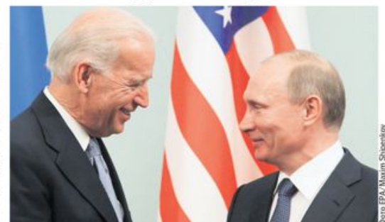
Џозеф Бајден и Владимир Путин