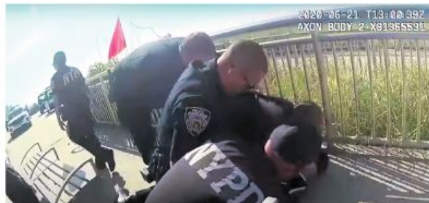
Припадници њујоршке полиције хапе осумњаног

У истом периоду прошле године настрадао је 69, а повређено 387 становника. Ови случајеви за бележени су углавном у Бруклину, Квинсу и Бронксу, а како јавља Фокс њуз, жртве су у највећем броју млади људи у двадесетим годинама, тинејџери, па и деца. страна 2