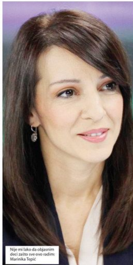
Nije mi lako da objasnim deci zašto sve ovo radim: Marinika Tepić

INTERVJU Marinika Tepić, potpredsednica Stranke slobode i pravde