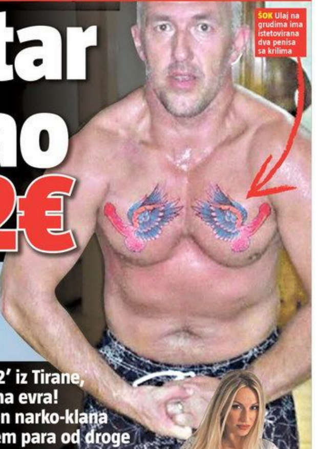
50K Ulej na grudima ima istetovirana dva penisa sa krilima