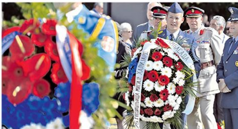
Војне делегације савезничких земаља на свечаности у Прањанима

Због жртава које је поднела у борби против фашизма, наша земља никада неће дозволити ревизију историје, поручио је Александар Вучић