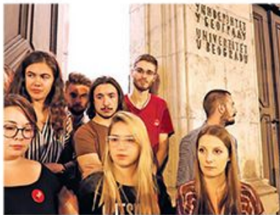
Студенти су синоћ накратко изашли испред зграде

– Хвала нам, за сада нећемо да причамо с медијима. Доћићете наше саопштење путем агенција – рекли су углавном младић и девојка с друге стране заманљавих врата.