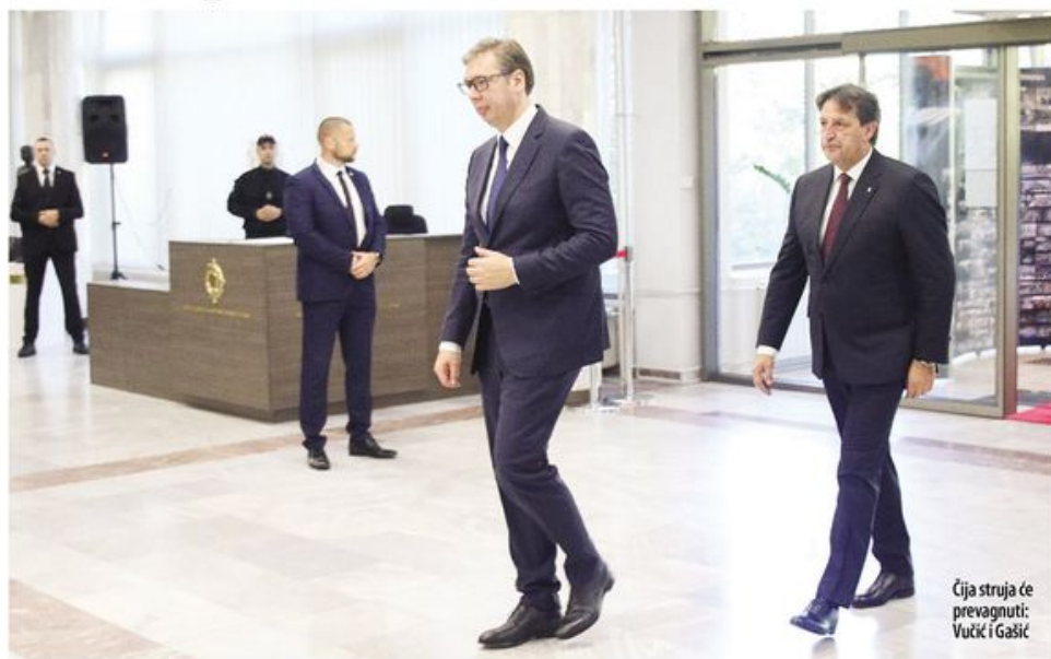
Čija struja će prevagnuti: Vučić i Gašić