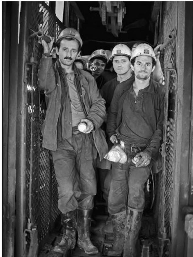
Једна од смена копача „црног злата“ пред силазак у окно, неколико месеци пре трагедије