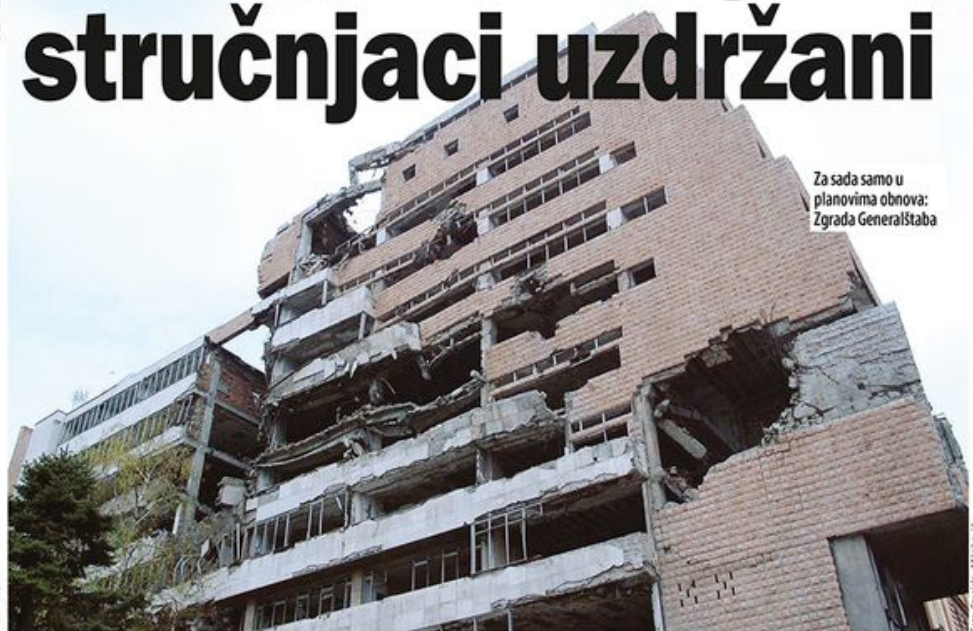
Za sada samo u planovima obnova: Zgrada Generalštaba