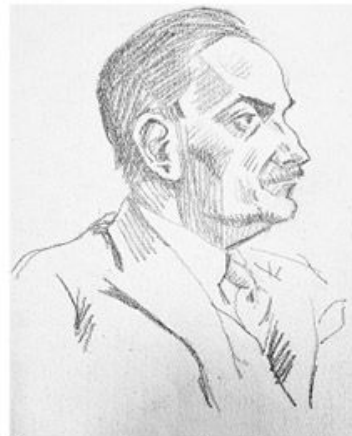
Немачки генерал Александар Лера, који је припремио и спровео бомбардовање Београда 6. априла 1941.

Из фонда Музеја жртва геноцида, „Политика“ ексклузивно објављује портрете немачких официра осуђених у Београду 1947, које је нацртао уметник чији је ликовни израз деценијама био заштитни знак нашег листа