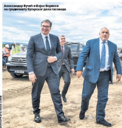
Александар Вучић и Бојко Борисов на градјелишту бугарског дела гасовода

Србија и Бугарска судје пријатељ- ске земље, које раде заједно на два велика пројекта од суштинског значаја за обе државе – ауто-путу и гасоводу, поручио је председник званичне посе- те Бугарској, где му је домаћин био премијер Бојко Борисов. На заједнич- кој конференцији за медије после оби- лазак деонице ауто-пута од српско- бугарске границе до Софије и будућег гасовода „Балкански ток“, којим ће се дотрети гас из „Турског тока“, Ву- чић је захвалио Борисову, што је, како каже, уложило много труда, енергије и ентузијазма у прављење најбољих мо- гућих односа између Србије и Бугар- ске, и Срба и Бугара. Од јуче је, иначе, отворена граница између Србије и Бугар- ске и грађани две земље немају оба- везу карантина.