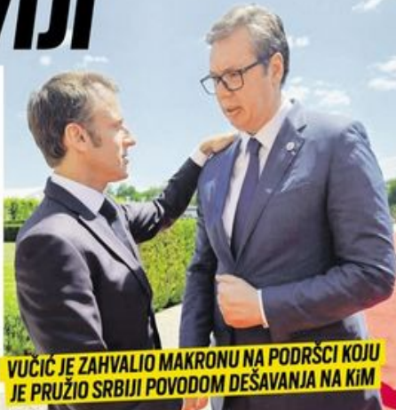
VUČIĆ JE ZAHVALIO MAKRONU NA PODRŠCI KOJU JE PRUŽIO SRBIJI POVODOM DEŠAVANJA NA KIM