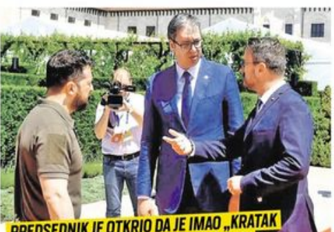
PRESEDNIK JE OTKRIO DA JE IMAO „KRATAK I DOBAR RAZGOVOR SA ZELENSKIM“