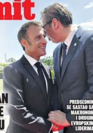
PREDSEDNIK SE SASTAO SA MAKRONOM I DRUGIM EVROPSKIM LIDERIMA

VUČIĆ: SADA JE SVIMA JASNO KO JE ODGOVORAN ZA NASILJE NA KOSOVU