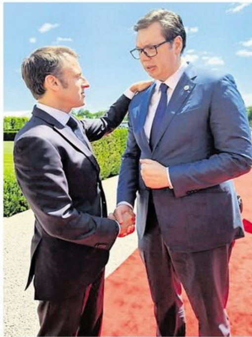
Емануел Макрон и Александар Вучић јуче у Кишињеву