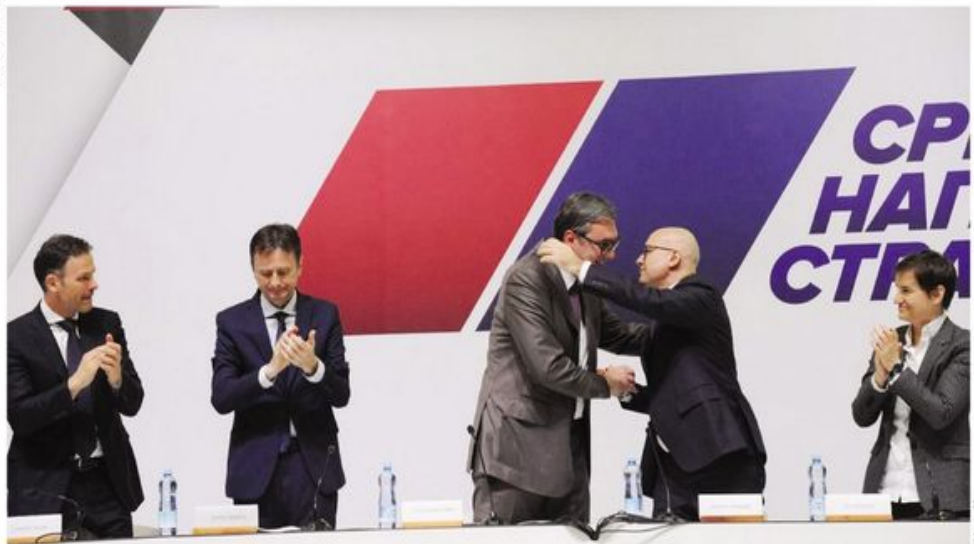
Predaja vlasti rukovanjem: Sa Skupštine SNS u Kragujevcu

Novi policijsko-sindikalni savez uputio otvoreno pismo predsedniku Srbije