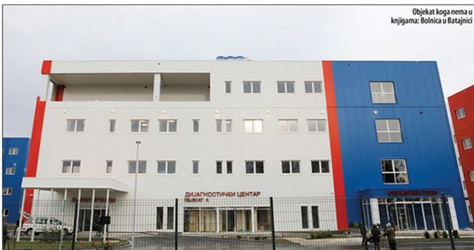
Objekat koga nema u knjigama: Bolnica u Batajnici

Iako predsednik tvrdi da dozvola postoji, njegovi saradnici ne odgovaraju na poruke s jednostavnim pitanjem - pod kojim se brojem vodi ta građevinska dozvola. Ako