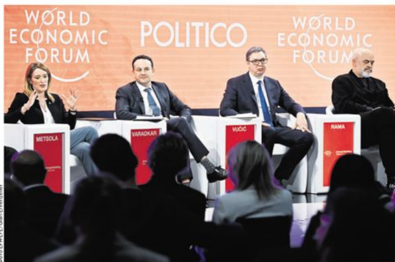
Роберта Мецола, Лео Варадкар, Александар Вучић и Ели Рама на панелу „Ширење европског хоризонта“