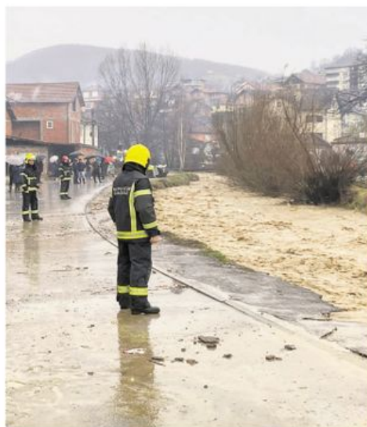
У Новом Пазару проглашена ванредна ситуација

У акцију су одмах ступили и сви надлежни да би помогли житељима поплављених подручја. О томе шта се догађа на терену чланове владе информисали су потпредседник владе и министар одбране Милош Вучевић и министар унутрашњих послова Братислав Гашић. Потпредседник Вучевић рекао је да су припадници Војске Србије на терену, а да су сви капацитети војске стављени на располагање. Одмах након седнице, министар Гашић упутио се у обилазак поплављених подручја. стр. 7