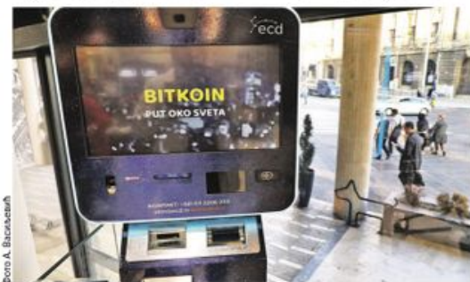
Биткоин банкомат у Београду

На дигиталну имовину плаћа се порез од 15 одсто на капиталну добит на разлику између набавне и продајне вредности, као код акција и хартија од вредности