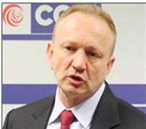
Demokrate neće preispitivati odluku o ulasku u Savez za Srbiju zbog neprimerenih izjava lidera Dveri