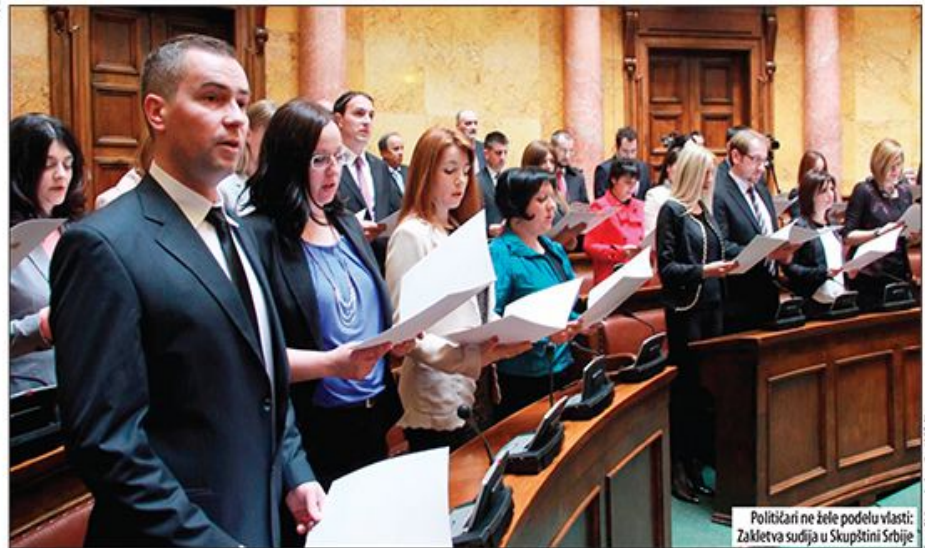
Političari ne žele podelu vlasti: Zakletva sudija u Skupštini Srbije