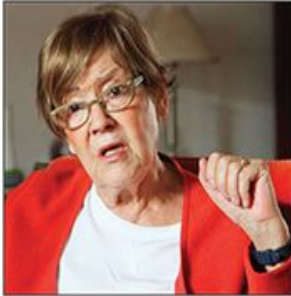
Poznata sociološkinja posle spornog tvita govori za Danas o stanju u društvu