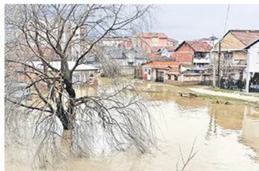
Ибар поплавио Бошњанку махалу у Косовској Митровици

Косовска Митровица – Ситуација коју су изазвале поплаве надошлог Ибра и бујичних потока најтежа је у последњих 50 година на територији четири општине на северу Космета.