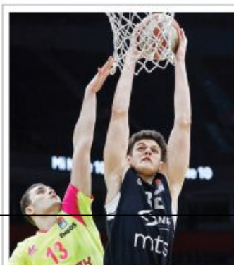
Crno-belima FIBA Liga šampiona trenutno uopšte nije prioritet

Za policiju nije isto kad protestuju SNS i radnici PKB Strana 11