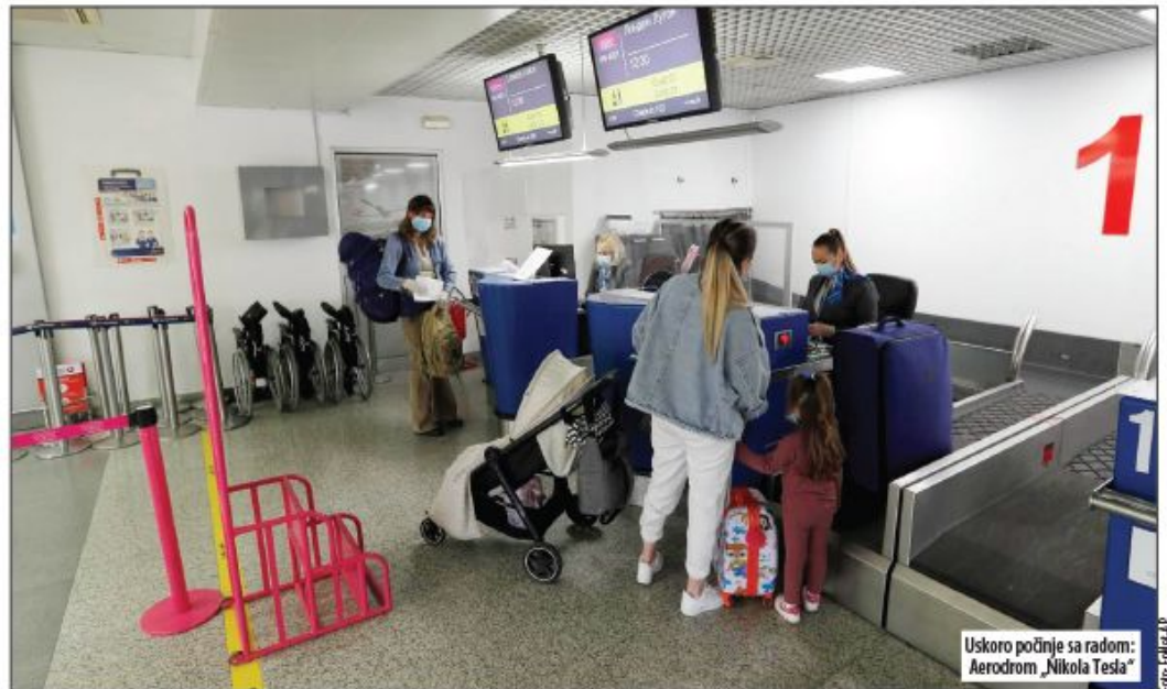
Uskoro počinje sa radom: Aerodrom „Nikola Tesla“

■ Milan Kovačević , konsultant za investicije: Da su dve kompanije (Aerodrom i Vansi) potpisale ugovor, dobro bismo stajali. Ovakvo pozivanje na višu silu pada u vodu, jer je Vlada zabranila rad aerodroma