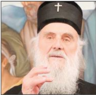
Patrijarh SPC Irinej za Danas

Obradović uvek radi šta hoće i na svoju ruku Strana 3