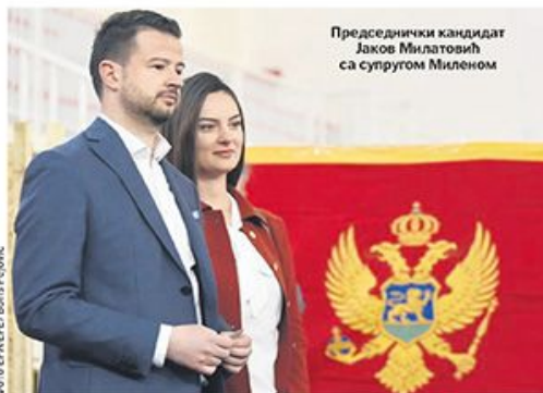
Председнички кандидат Јаков Милатовић са супругом Миленом

Милатовић је фаворит, али Мило Ђукановић се не предаје. Гласање без тензија, часни потези кандидата који су завршили изборну трку