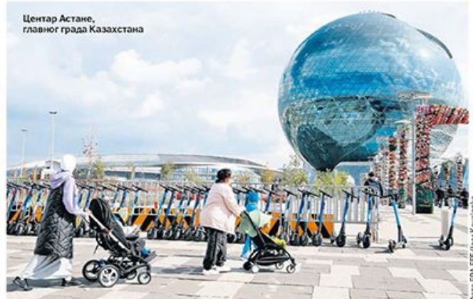
Центар Астане, главног града Казахстана