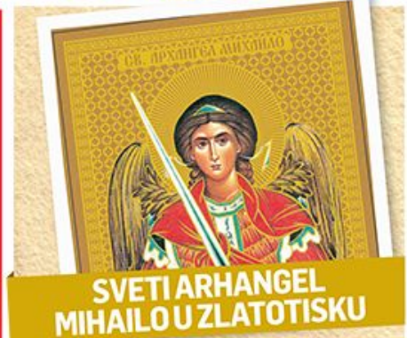
SVETI ARHANGEL MIHAILO U ZLATOTISKU