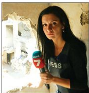
Dilijana Gajtandžijeva, bugarska novinarka, koja je prva objavila tvrdnje o nezakonitoj trgovini oružjem iz Srbije