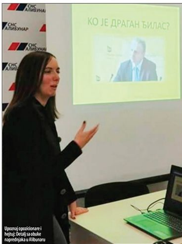
Upoznaj opozicionare i hejtuj: Detalj sa obuke naprednjaka u Alibunaru