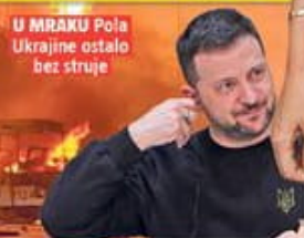
U MRAKU Pola Ukrajine ostalo bez struje