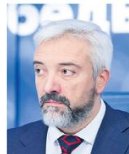
ИНТЕРВЈУ: ЈЕВГЕНИЈ ПРИМАКОВ, директор „Росотрудничества“

„Људи у хали су легли на под да избегну пуњање, лежали су 15–20 минута, а онда почели да излазе. Многи су успели да изађу“, рекао је извештач РИА Новости. страница 3