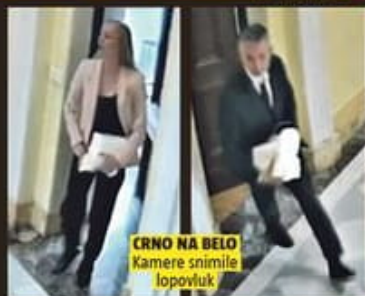
CRNO NA BELO Kamere snimile lopovluk

Broj 3445 / 40 dinara / Republika Srpska 1 KM / Crna Gora 0,7 EUR