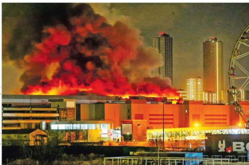
Пожар у тржном центру „Крокос“ избио је пошто су нападачи наводно бацили бомбу у салу

На десетине људи је убијено, а више од 50 рањено јуче по подне у концертној хали „Крокос сити хол“ у Москви приликом масовне пуњање. Уочи наступа рок бенда „Пикник“ најмање четворица мушкараца у маскарним униформама отворила су ватру из аутоматског оружја на окупљене на улазу у концертну салу. Ондах после пуњање у згради је избио пожар, а на снимцима који су се синоћ ширили друштвеним мрежама, како је пренео Тајгу, могао се видети густ дим како избија из зграде.