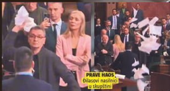
PRAVE HAOS Đilasovi nasilnici u skupštini