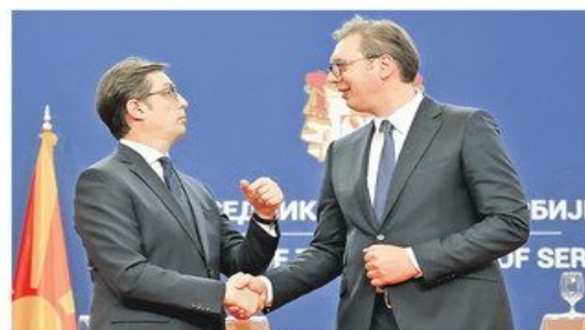
Стево Пендаровски и Александар Вучић јуче у Београду