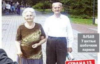
ЉУБАВ У шестом шабачком парку

Волели се цео живот и умрли у истом дану