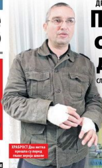
ХРАБРОСТ Два митка прошла су поред главе хероја школе