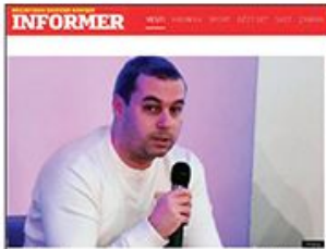
OVO MORATE DA PROČITATE! Ištvan Kaić: Narkomani i alkoholičari novinarstva!

Režimski mediji preneli članak u kome se novinari nazivaju narkomanima i alkoholičarima