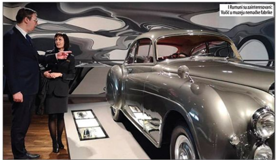
I Rumuni su zainteresovani: Vučić u muzeju nemačke fabrike