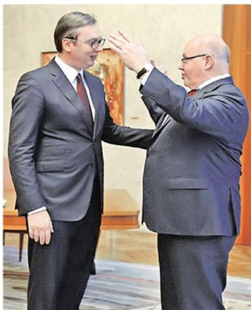
Председник Србије и немачки министар економије и енергетике