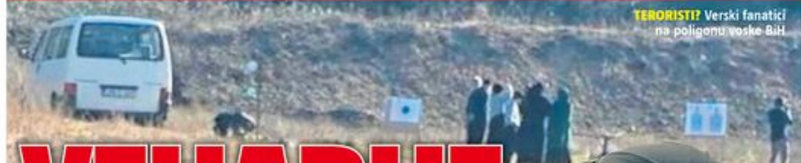
TERORISTI? Verski fanatici na poligonu voške BiH