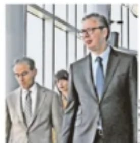
Мухамед Алабар и Александар Вучић