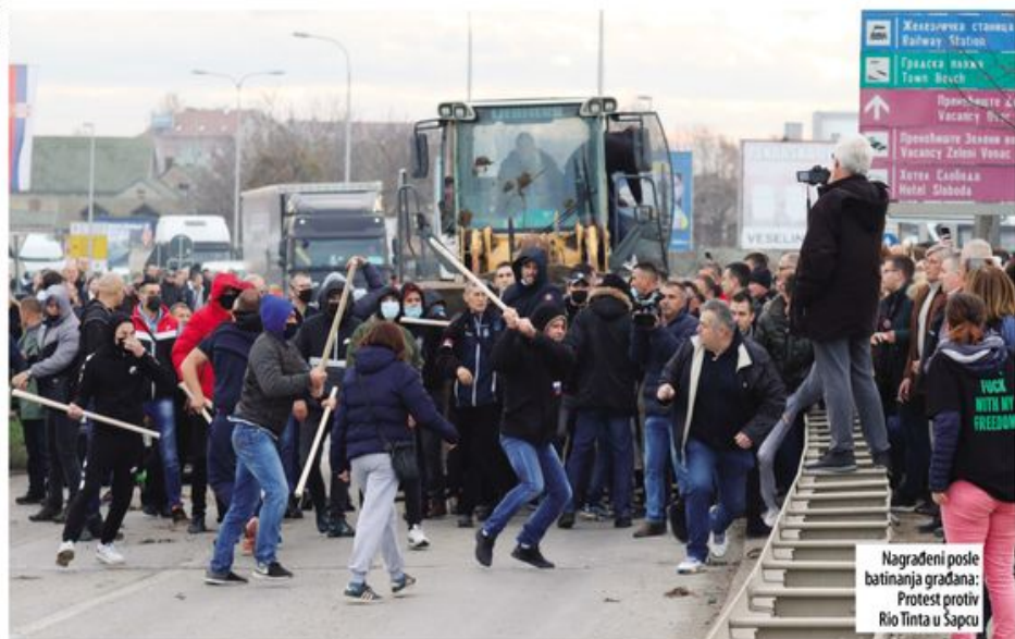
Nagrađeni posle batinanja građana: Protest protiv Rio Tinta u Šapcu