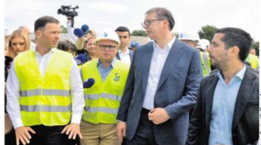
Синиша Мали, Горан Весић, Александар Вучић и Томислав Момировић