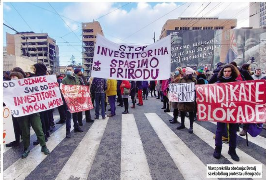
Vlast prekršila obećanja: Detalj sa ekološkog protesta u Beogradu