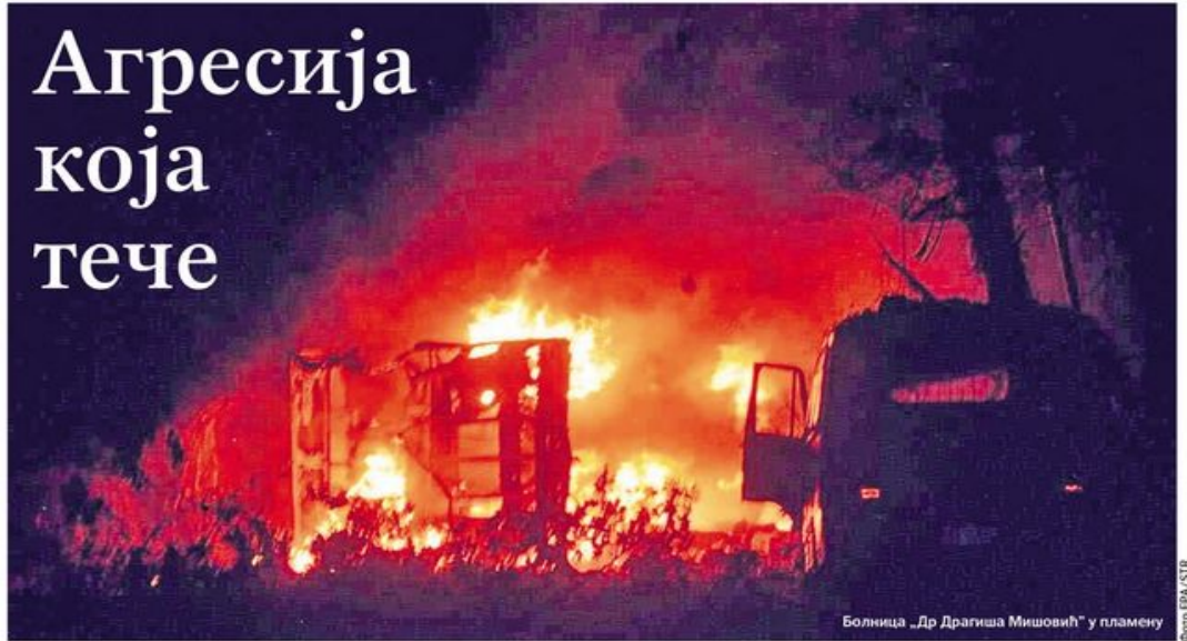
Болница „Др Драгиша Мишовић“ у пламену