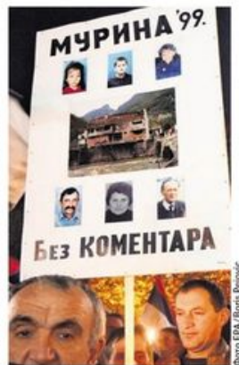
Са једног од протеста у Подгорици

Познато је да црногорска власт већ 30 година упорно понавља, чак се хвали, како је „НАТО поштедео Црну Гору бомбардовања и разарања“, не помињући ниједну жртву тог злочина. страница 4