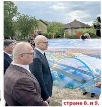
странице 8. и 9.

СПОЈЕНИ КОЛОСЕЦИ НА БРЗОЈ ПРУЗИ Од Београда до Суботице возићемо се за 80 минута