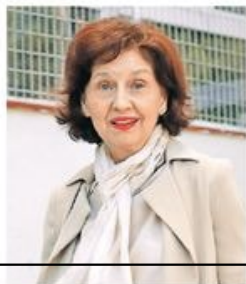
Гордана Сиљановска Давкова

Скопље – У првом кругу председничких избора у Северној Македонији кандидат ВМРО-ДПМНЕ Гордана Сиљановска Давкова освојила је 40,08 одсто, док је актуелни председник Стево Пендаровски освојио 19,93 одсто подршке бирача, саопштила је Државна изборна комисија. Њих двоје ће снаге одмерити у другом кругу председничких избора 8. маја, за када су заказани и парламентарни избори. страница 4