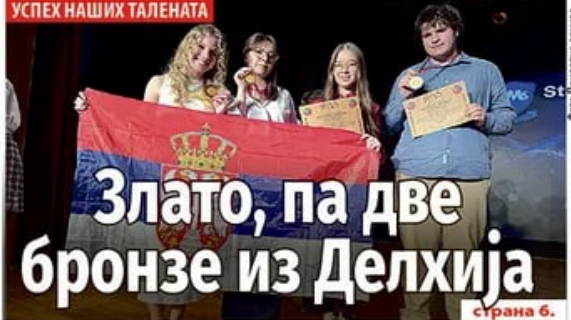
Фото: Првотурин страна 6.