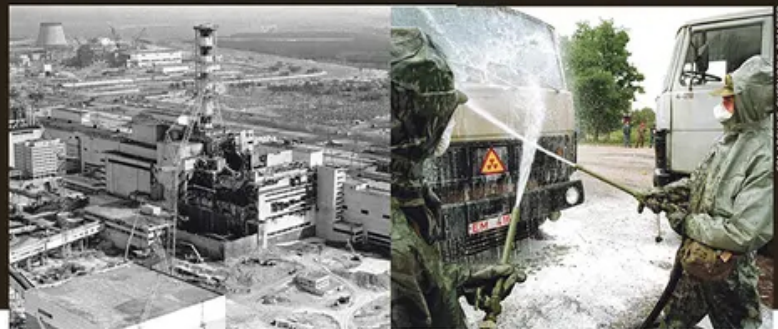
CHERNOBYL DISASTER

Oblak je 29. aprila stigao do Slovenije, vetar ga je nad Srbiju doneo 1. maja, baš kada su građani boravili na urancima na otvorenom, ne znajući šta se dešava